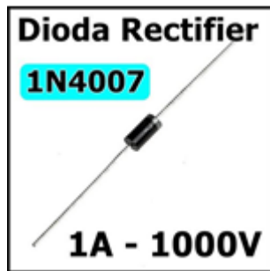
Gambar 7. DIODA 1N4007

Termasuk diode penyearah, diode penyearah adalah sebuah komponen yang terbuat dari bahan semikonduktor. Diode rectifier pada dasarnya terdiri dari 2 lapisan semikonduktor P (positif) dan N (negatif). Dioda rectifier ini memiliki fungsi untuk menghantarkan arus listrik pada saat bias maju (forward bias) dan menghambat arus listrik pada saat bias balik (reverse bias).