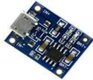
Gambar 5. MODUL TP4056

TP4056 adalah modul untuk mengisi baterai isi ulang Lithium (Li-ion rechargeable battery) 1 Ampere yang dilengkapi dengan 2 lampu indikator, masing-masing menunjukkan status saat mengisi ulang (LED merah) dan saat baterai sudah terisi penuh (LED biru).