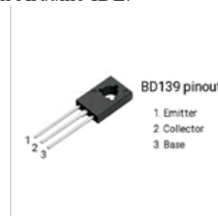
Gambar 6. TRANSISTOR BD139

Transistor multiguna tipe NPN dan berjenis PNP. Yang berfungsi untuk sebagai penguat signal audio dan saklar/switch. cukup dengan menghubungkan kabel ke komputer yang sudah terinstall Arduino IDE.