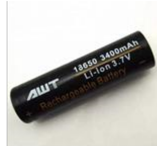
Gambar 9. Baterai ION Litium

Baterai ion litium (biasa disebut Baterai Li-ion atau LIB) adalah salah satu anggota keluarga baterai isi ulang (rechargeable battery). Di dalam baterai ini, ion litium bergerak dari elektroda negatif ke elektroda positif saat dilepaskan, dan kembali saat diisi ulang. Baterai Li-ion memakai senyawa litium interkalasi sebagai bahan elektrodanya, berbeda dengan litium metalik yang dipakai di baterai litium non-isi ulang.