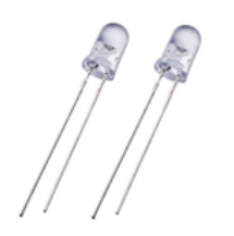
Gambar 8. LED 5mm 3,4 Volt

LED merupakan kependekan dari Light Emitting Diode, yakni salah satu dari banyak jenis perangkat semikonduktor yang mengeluarkan cahaya ketika arus listrik melewatinya.