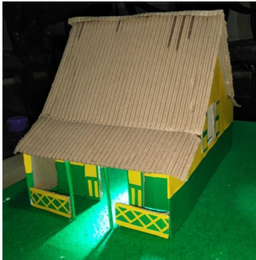
Gambar 4. Hasil Pengamatan

Dari tahapan percobaan hingga memperoleh hasil percobaan atau pengujian Rangkaian Lampu Emergency untuk Miniature Rumah Adat Betawi dengan Transistor dan Modul TP4056 dapat dianalisis sebagai berikut :