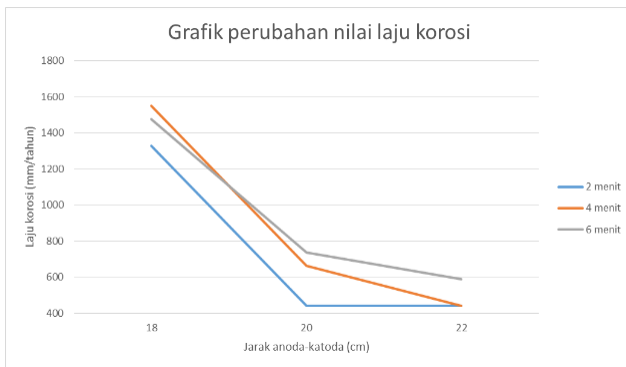
Gambar 4. Perbandingan perubahan nilai laju korosi terhadap jarak anoda-katoda pada masing-masing waktu

Dari gambar 4 terlihat bahwa pada variabel waktu yang sama, nilai laju korosi semakin menurun seiring bertambahnya jarak anoda-katoda. Sehingga bisa dikatakan bahwa penambahan jarak anoda-katoda pada proses anodizing Aluminium berbanding lurus dengan penurunan nilai laju korosi yang terjadi.