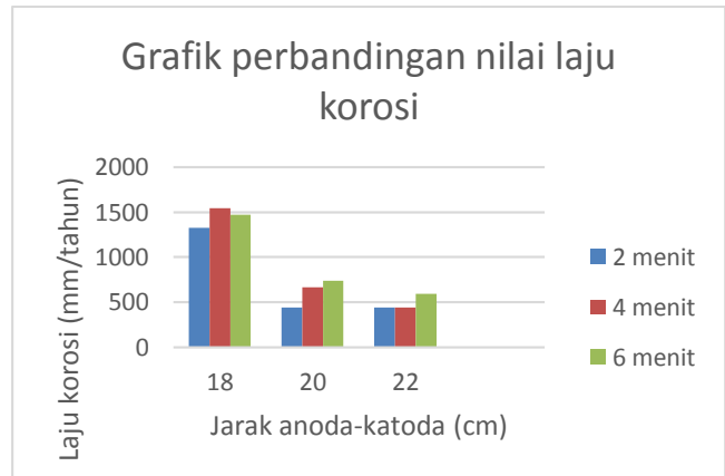
Gambar 3. Garfik perbandingan nilai laju korosi

Dari Tabel 2 dapat dilihat bahwa pada proses anodizing dengan waktu 2 menit pada masing-masing jarak anoda-katoda menunjukkan nilai laju korosi yakni pada jarak 18 cm mendapatkan nilai laju korosi sebesar 1327,5 mm/tahun. Sedangkan pada jarak 20 cm sebesar 442,5 mm/tahun dan pada jarak 22 cm sebesar 442,5 mm/tahun. Pada proses anodizing dengan waktu 4 menit pada masing-masing jarak anoda-katoda menunjukkan nilai laju korosi yakni pada jarak 18 cm mendapatkan nilai laju korosi sebesar 1548,7 mm/tahun. Sedangkan pada jarak 20 cm sebesar 663,7 mm/tahun dan pada jarak 22 cm sebesar 442,5 mm/tahun. Pada proses anodizing dengan waktu 6 menit pada masing-masing jarak anoda-katoda menunjukkan nilai laju korosi yakni pada jarak 18 cm mendapatkan nilai laju korosi sebesar 1.475 mm/tahun. Sedangkan pada jarak 20 cm sebesar 737,5 mm/tahun dan pada jarak 22 cm sebesar 590 mm/tahun. Perbandingan nilai laju korosi dapat dilihat pada Gambar 3.