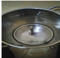
Gambar 3. Cover tabung filter

Cover tabung filter adalah suatu komponen alat spinner yang berfungsi sebagai wadah dari tabung filter dan sebagai wadah penampungan minyak hasil penirisan, dimana nantinya minyak tersebut akan dialirkan keluar dari tabung melalui saluran pembuangan minyak yang ada dicover tabung filter . Tabung ini dibuat dari bahan stainless .