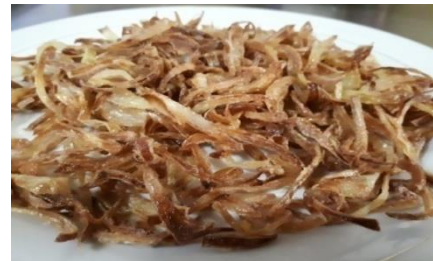
Gambar 7 Bawang goreng menggunakan cara tradisional

Alat hasil rancangan yang dibuat sudah memenuhi kebutuhan perancangan. Alat spinner ini dapat dikatakan ergonomis karena dibuat berdasarkan data anthropometry tubuh manusia yaitu karyawan PT. Baasithu sehingga alat ini mudah digunakan. Kemudian setelah alat ini selesai dirancang dilakukan pengujian dengan dua cara yaitu dengan cara tradisional (ditiriskan dengan diangin-anginkan) dan dengan bantuan alat. Hasil penirisan dapat dilihat pada gambar berikut Gambar 4.8 Bawang goreng menggunakan cara tradisional Gambar 4.9 Bawang goreng menggunakan alat Setelah dilakukan pengujian dimana sampel yang ditiriskan dengan waktu yang sama dengan cara tradisional dan dengan menggunakan alat. Bawang yang ditiriskan menggunakan alat lebih terlihat kering dan renyah dibandingkan dengan cara tradisional dimana bawang masih terlihat basah dan layu.