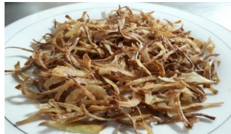
Gambar 8 Bawang goreng menggunakan alat

Data anthropometry dari 5 responden dapat digunakan sebagai dasar perancangan alat spinner , karena setiap responden dilakukan pengulangan sebanyak 4 kali sehingga jumlah total data yang didapatkan sebanyak 20 data. Dimensi yang digunakan pada perancangan alat spinner ini adalah: