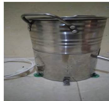
Gambar 1. Alatspinnergorengan

Jadi tabung cover dengan diameter 20 cm dan tinggi 12,2 (11 cm+1,2 cm) memiliki kapasitas tanpungan minyak sementara sebanyak 3820,8 cm 3 .