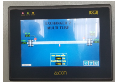
Gambar 4. Pembacaan data hasil pengujian

Untuk percobaan dengan aliran 1000 l/h, kecendrungan data yang dihasilkan juga berbanding lurus dengan lamanya waktu pengambilan data.