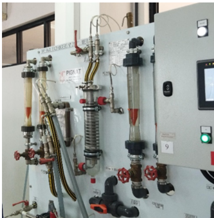
Gambar 3. Heat exchangers Pignat model BME/4000

Penelitian ini dilaksanakan di laboratorium ELDA, Politeknik Negeri Medan. Adapun alat yang digunakan pada penelitian ini adalah Heat Exchangers Pignat model BME/4000 dengan dimensi L (165 cm), P (90 cm), H (190 cm), sesuai yang tertera di gambar 3.