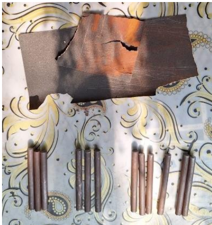
Gambar 2. Proses Penghalusan Permukaan Spesimen

Sebelum dicampur dengan resin dan katalis, permukaan spesimen dibersihkan dengan menggunakan sikat kawat yang lunak atau amplas halus agar pelapisan dapat menyatu dengan baik. Resin dan katalis kemudian dicampur sesuai dengan perbandingan yang diperlukan, diaduk hingga merata. Spesimen uji kemudian dicelupkan ke dalam campuran yang sudah diaduk, diangkat, dan digantung agar pelapisan merata di seluruh bagian spesimen uji.