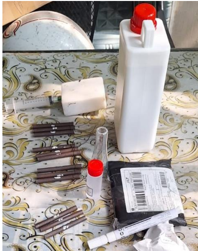
Gambar 1. Persiapan Spesimen

Sebelum dicampur dengan resin dan katalis, permukaan spesimen dibersihkan dengan menggunakan sikat kawat yang lunak atau amplas halus agar pelapisan dapat menyatu dengan baik. Resin dan katalis kemudian dicampur sesuai dengan perbandingan yang diperlukan, diaduk hingga merata. Spesimen uji kemudian dicelupkan ke dalam campuran yang sudah diaduk, diangkat, dan digantung agar pelapisan merata di seluruh bagian spesimen uji.