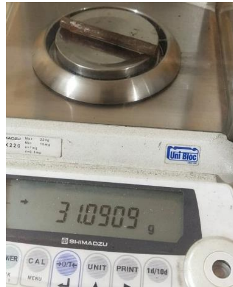
Gambar 4. Proses Penimbangan Spesimen Menggunakan Timbangan Digital

Penimbangan spesimen dilakukan sebelum diekspos selama 40 hari dilakukan menggunakan timbangan digital dengan akurasi 0,0001 gram.