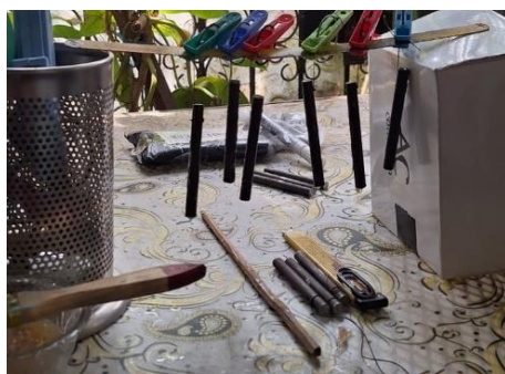
Gambar 3. Prose Pengeringan Spesimen Setelah Pengaplikasian Resin