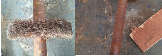
Gambar 4. Kondisi Poros Yang Korosi

Berdasarkan hasil observasi dan dilakukan diskusi dengan teknisi dari beberapa komponen mesin rustic yang sering terjadi kerusakan adalah poros. Dikarenakan poros ini adalah tempat bagi sikat kawat dapat berputar, karena sikat kawat juga mudah mengalami kerusakan yaitu korosi maka poros yang fungsinya sebagai pemutar sikat kawat ini secara tidak langsung juga terkontaminasi korosi akibat sikat kawat juga mengalami korosi. Dan tentunya ada beberapa penyebab lain yang mengakibatkan kerusakan pada poros.