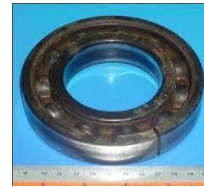
Gambar 5. Bearing Yang Korosi Dan Aus

Bantalan adalah elemen mekanis yang membatasi pergerakan relatif dua atau lebih komponen dalam suatu mesin, sehingga memungkinkan komponen tersebut bergerak ke arah yang diinginkan. Fungsi bearing adalah untuk menopang poros agar dapat berputar tanpa adanya gesekan yang berlebihan. Namun karena posisinya yang penting bagi poros untuk berputar sering kali bearing mengalami kerusakan. Hasil observasi dilapangan ditemukan ada beberapa penyebab kerusakan yang terjadi pada bearing.