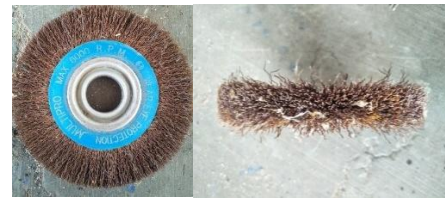
Gambar 3. Sikat Kawat Yang Mengalami Korosi

Dari pengamatan yang telah dilakukan dapat disimpulkan bahwa rusaknya sikat kawat rustic dapat disebabkan oleh berbagai faktor, dan penyebabnya dapat bervariasi tergantung pada kondisi penggunaan dan perawatan sikat tersebut.