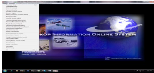
Gambar 2. System voucher online

Karyawan PT. Bosowa Asuransi Cabang Jambi diwajibkan membuat akun skype, karena aplikasi ini digunakan sebagai media komunikasi setiap karyawan baik karyawan yang ada dikantor-kantor cabang maupun dari kantor pusat. Aplikasi ini juga selain untuk media komunikasi agar setiap karyawan dapat dari seluruh kantor cabang maupaun karyawan yang ada dikantor pusat dapat mengenal satu sama lain, sehingga dapat terjalin kerjasama yang baik dan dapat juga digunakan untuk mengirim file atau data, seperti laporan keuangan, laporan klaim atau data-data yang diminta kantor pusata mauapun kantor cabang lainnya, Karena aplikasi skype lebih cepat dan mudah digunakan untuk berkomunikasi dan mengirim data atau file. Aplikasi ini buka milik perusahaan, tetapi aplikasi ini merupakan aplikasi media sosial yang digunakan atau dimanfaatkan oleh setiap karyawan untuk membantu dalam proses kerja, terutama dalam hal berkomunikasi kepada karyawan lainnya. Berikut adalah contoh dari tampilan aplikasi skype :