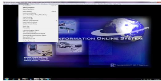
Gambar 1. Aplikasi underwriting perusahaan

meringankan pekerjaan dari setiap karyawan dan dapat juga mengatasi jika terjadi kelalaian karyawan, ketika data nasabah atau copy polisnya hilang. karena setiap data nasabah yang dimasukkan ke system atau aplikasi underwriting semuanya dapat dilihat bahkan dari tahun-tahun sebelumnya. System atau aplikasi underwriting merupakan aplikasi yang sudah menjadi hak paten dari PT. Bosowa Asuransi, jadi sangat rahasia dan tidak boleh dipublikasikan kesembarang orang atau perusahaan, karena system atau aplikasi ini banayak menyimpan data-data perusahaan yaitu data-data polis asuransi. Berikut adalah contoh dari tampilan system atau aplikasi underwriting :