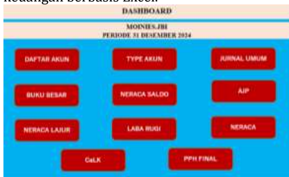
Gambar 1. Dashboard

Dashboard Excel ini dirancang agar pengguna dapat mengakses setiap modul pembukuan dengan cepat, mudah, dan terorganisir dengan satu klik. Halaman utamanya berfungsi sebagai pusat navigasi seluruh lembar kerja sistem pencatatan keuangan berbasis Excel.