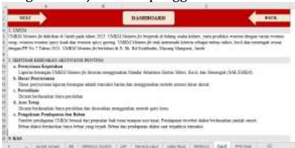
Gambar 8. CaLK

Catatan atas laporan keuangan merupakan bagian penting dari penyajian laporan keuangan berdasarkan SAK EMKM. CaLK dibuat untuk memberikan informasi tambahan yang menjelaskan kebijakan akuntansi yang digunakan, rincian pos-pos dalam laporan keuangan, dan informasi penting lainnya sehingga laporan keuangan dapat dipahami dengan lebih jelas oleh pengguna.