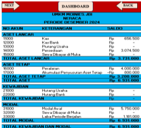
Gambar 8. Neraca