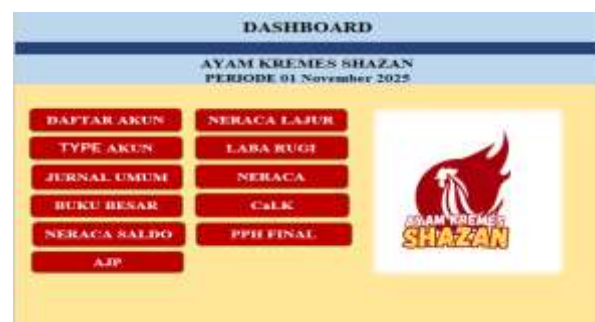
Gambar 3. Dashboard Excel Laporan Keuangan UMKM

Proses penyusunan laporan keuangan pada UMKM Ayam Kremes Shazan diawali dengan perancangan template Microsoft Excel yang disesuaikan dengan ketentuan SAK EMKM. Template ini mencakup seluruh siklus akuntansi, mulai dari pencatatan transaksi pada jurnal umum hingga penyusunan laporan keuangan dan perhitungan PPh Final. Penggunaan fungsi dan rumus otomatis dalam Excel memungkinkan integrasi data antar lembar kerja, sehingga proses pencatatan menjadi lebih sistematis, efisien, dan meminimalkan kesalahan perhitungan manual.