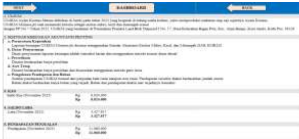
Gambar 11. Template CaLK Priode November 2025