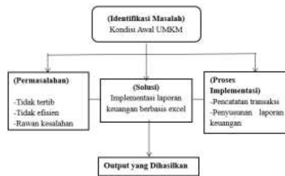
Gambar 1. Kerangka Berpikir