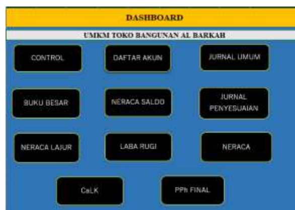
Gambar 3. Tampilan Dashboard

Penelitian ini menyusun sistem laporan keuangan dan pajak sederhana berbasis Microsoft Excel untuk UMKM Toko Bangunan Al-Barkah. Template Excel dirancang mengikuti siklus akuntansi, mencakup lembar kode akun, jurnal umum, buku besar, neraca saldo, jurnal penyesuaian, neraca lajur, laporan laba rugi, neraca, catatan atas laporan keuangan, dan PPh Final. Semua perhitungan, pemindahan data antarlembar, dan penghitungan pajak dilakukan otomatis menggunakan rumus Excel untuk meminimalkan kesalahan dan memudahkan pemahaman bagi pelaku UMKM.